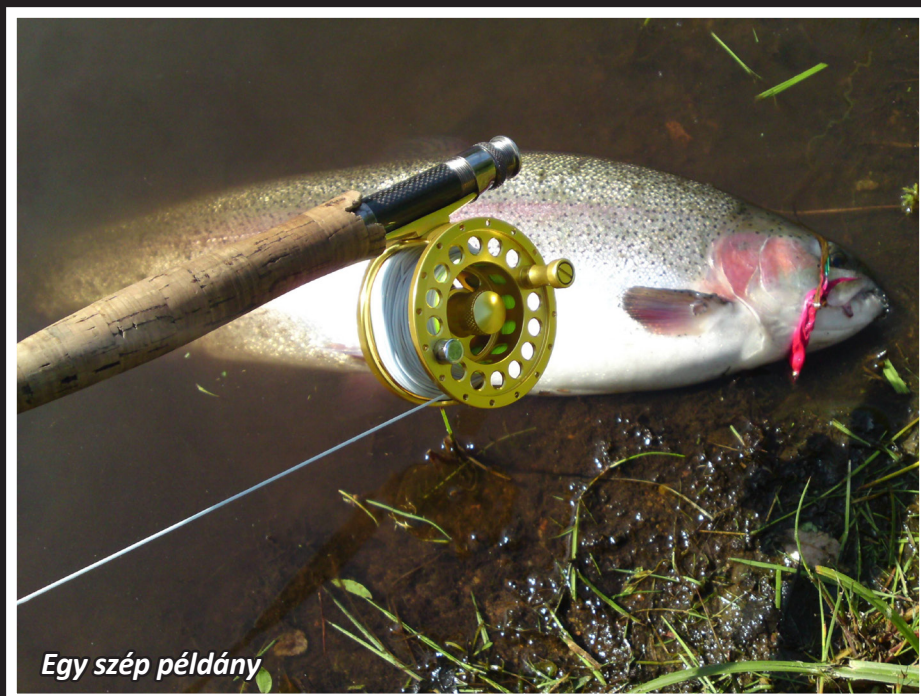
Egy szép példány