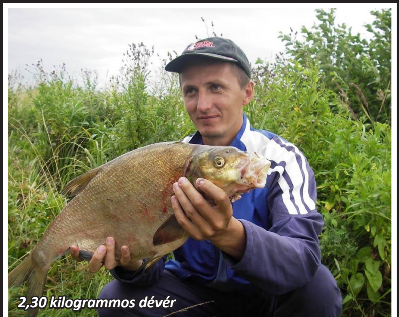
2,30 kilogrammos dévér

Ennyit a halélettanról, és még annyit: mindez A DÉVÉRRE vonatkozik!, és nem a karikakeszegre, a laposkeszegre, a bagolykeszegre, amelyet sok tudatlan horgász szép módszeresen összekever vele!!! A karika eleve később, május végén, június elején kezd ívni, a lapos és a bagoly