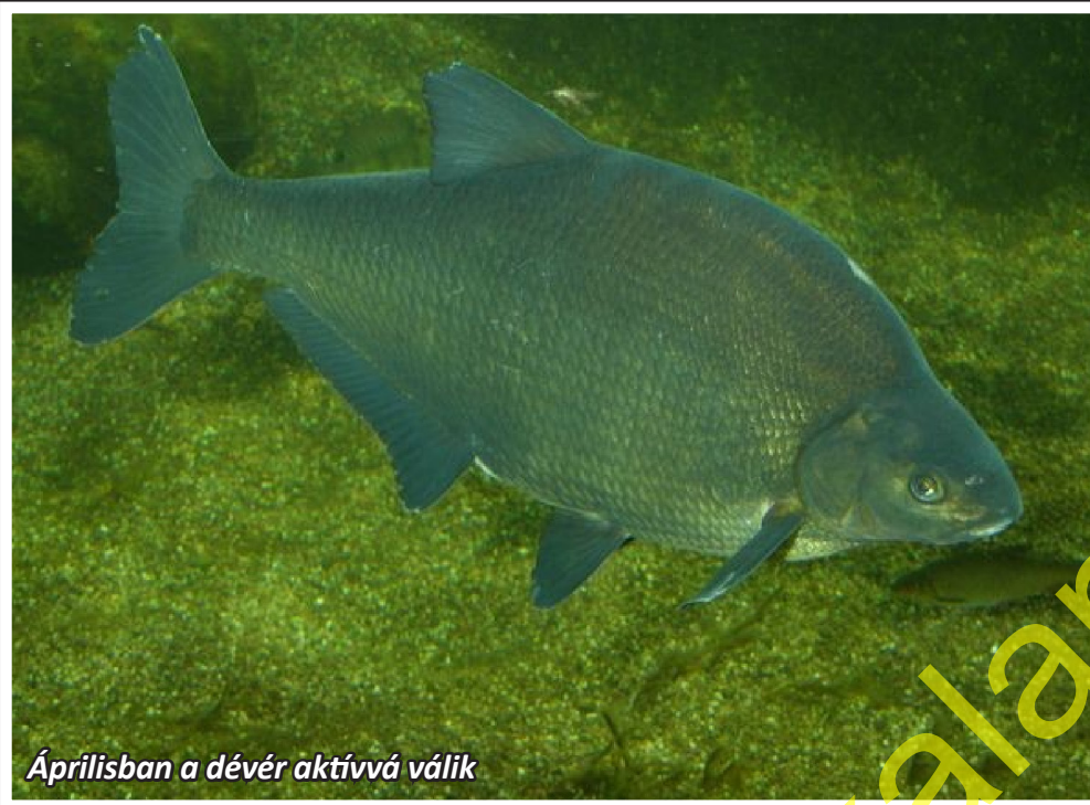
Áprilisban a dévér aktívává válik

Ha azt kérdezi valaki, hogy április második, és május első felében mire érdemes horgászni, a válasz egyértelmű: dévére. Hogy miért? Mert lassan már követetlen a tilalmak miatt. - van, ahol tilos a süllő, balin, van, ahol szabad, van, ahol csak pergetni tilos. Aztán májusban vagy van pontytillalom, vagy nincs, de ahol nincs, ott is lehet, hogy a víz ívóterületnek van nyilvánítva, és ezért nem pontyozhatunk, stb, stb.. - egyetlen biztos zsákmány van, amely elég nagyméretű és elég gyakori ahhoz, hogy zsákmányt is, sportélményt is adjon. A dévér!