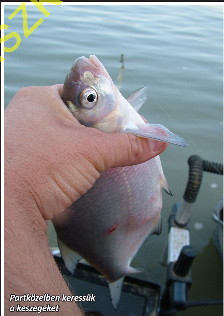
Partközelen keressük a keszegeket

Szóval: gondolkozva tiltsunk, és még valami: ha olyan vízen akar büntetni valaki, mert dévér ívóhelyen horgászunk – ahol később a túl sok keszegre való tekintettel akarnak „állományszabályozó hálószerkezet” végezni, amelynek során a lehalászók a „véletlenül” leszedett rablóhalat saját hasznukra adják el a piacon... Nos, akkor talán mégsem a horgász az etikátlan, hanem a simlis vezetője!