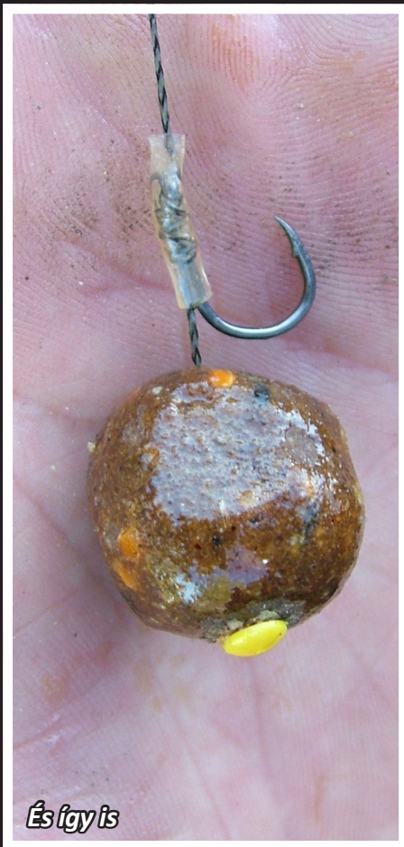
És így is