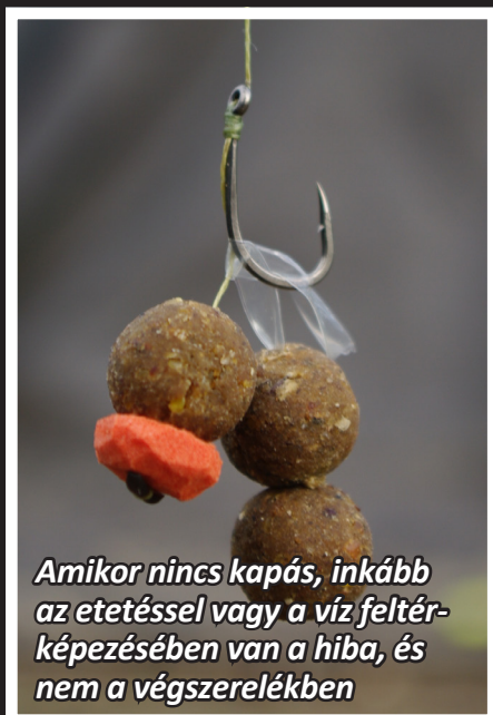
Amikor nincs kapás, inkább az etetéssel vagy a víz feltérképezésében van a hiba, és nem a végszerelékben