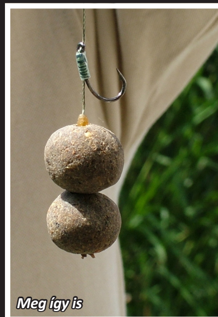
Meg így is

saját házamat tettem volna fel rá, olyan biztos voltam a végszerelékemben! Ez valami ijesztő!