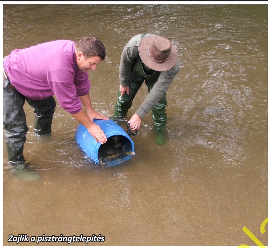
Zajlik a pisztrángtelepítés

folyócska komoly bevételi forrást jelent az ott élő emberek számára. Akik már régebb óta legyeznek, azok szinte kivétel nélkül megfordultak már a hasonló hazai vizeken, az útiköltség, a borsos napijegy és a szállásköltséggel együtt nem éppen kis összegeket hagytak ezeken a helyeken. Tehát ha itthon is jobban odafigyelnek azok, akiknek erre lehetőségük van, a nálunk elköltött ilyen bevételekből is lehetőség adódik arra, hogy egyre több hazai vizünkben élhessenek pisztrángok.