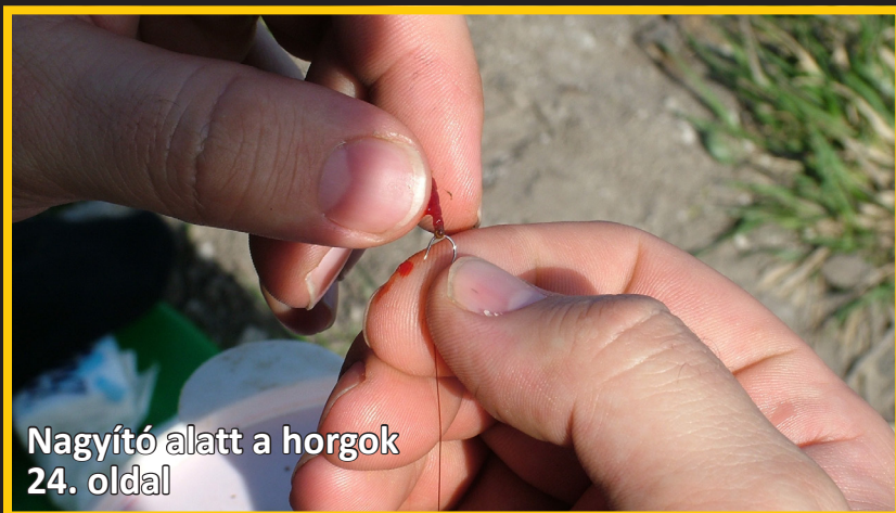
Nagyító alatt a horgok 24. oldal