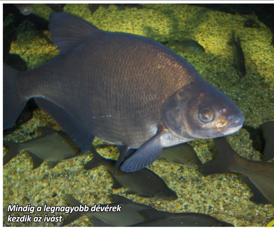
Mindig a legnagyobb dévérek kezdik az ívást

a lapólom felfekszik azokra, így csalink a hínár dzsungel felett marad. Ha ráadásul megosztjuk kétfelé a lapólmot, akkor végképpen biztos, hogy a csali fogós „magasságban” marad. Félreértés ne essék: most már nem vízközt kell a halat keresni, de ilyenkor a dévér nem veszi azt a fáradságot, hogy a hínár alá is lemenjen turkálni, éhes ugyan, de csak arra, amit kevés erőki-fejtéssel is eltud érni, azaz, a hínár leveleken lévő csalira – mert esze azért van, és az energiát a második ívársra szánja.