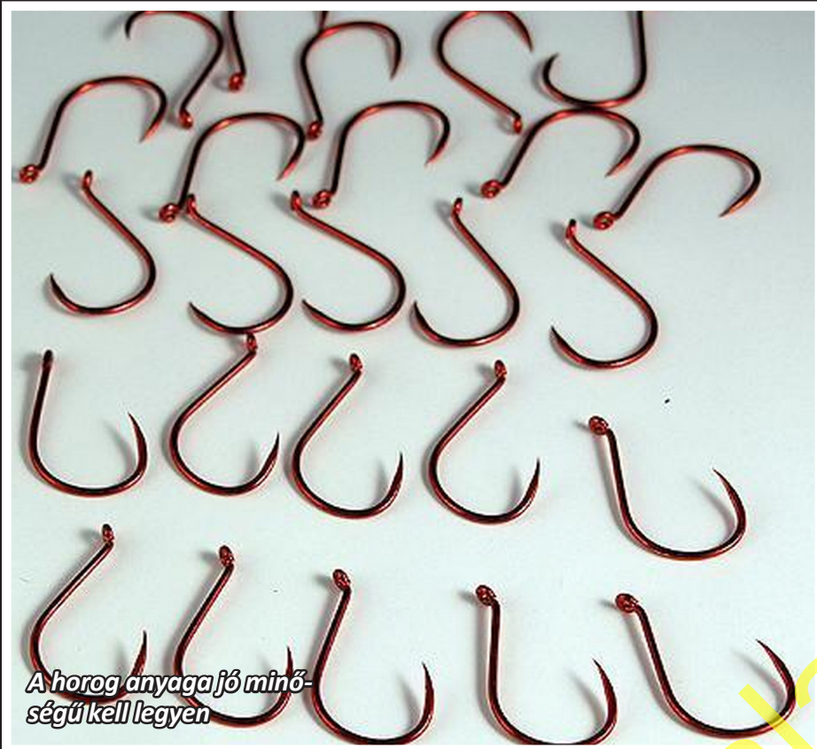
A horog anyaga jó minőségű kell legyen

3. Hosszú szárú horgok: a horog öble 3-szor fér bele a szár hosszúságába.