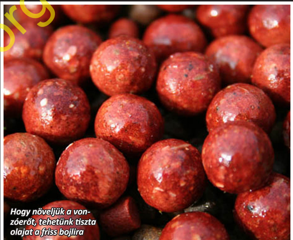
Hogy növeljük a vonzóerőt, tehetünk tiszta olajat a friss bojlira

nem elengedhetetlenek. Saját környezetemben az elsők között voltam, aki elkezdett ilyen bojlit használni, ráadásul aroma nélkül. Tapasztalataim azt mutatják, hogy az aroma nélküli bojlit, háromszor annyi halat fogtak, mint az aromásak. A halliszt alapú keverékekben megbízhatnak – egymagukban is tudnak pontyot