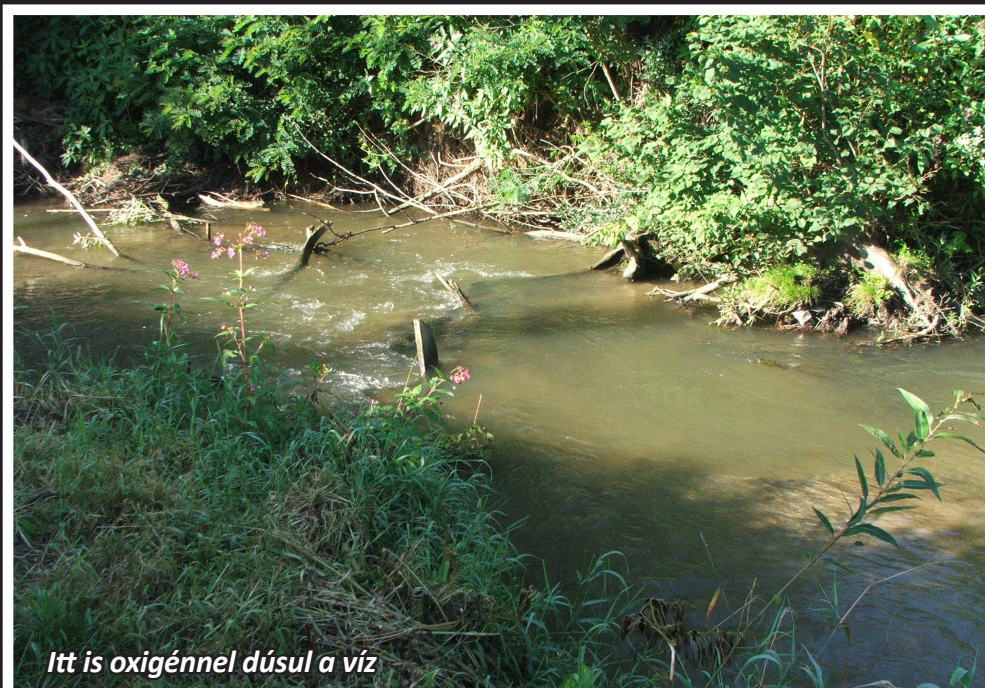
Itt is oxigénnel dúsul a víz

Nagyon lényeges dolog a víznek oxigénnel való dúsulása, mivel hazánkban meglehetősen meleg a nyarak. Ezeknek a patakoknak elsősorban a természetes módon keletkezett torlaszokon hangosan átbukó gyorsabb víz szolgálhat frissítésként. De a mesterségesen kialakított természetes jellegű surrantók is ezt a célt szolgálják. Arról nem is beszélve, hogy az uniós országokban ez már egy megszokott dolog, mert ott nem csak felismerték, hogy szükség van az ilyen létesítményekre, hanem támogatják is azt anyagilag. Ez is részét képezi a vizek renaturálásának. Az önkormányzatoknak is érdemes erre odafigyelni, mert az így létrejött jobb minőségű vizek, több horgászt fognak vonzani, és ezzel a helyi túrizmusból származó bevételeket is lehet növelni. Ezekre nagyon jó példák a környező országok, ahol egy-egy kisebb település mellett található