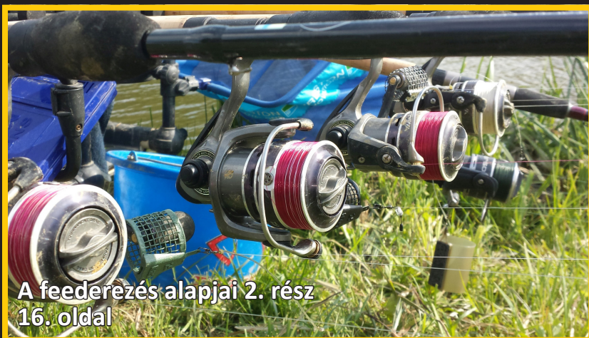
A feederézés alapjai 2. rész 16. oldal