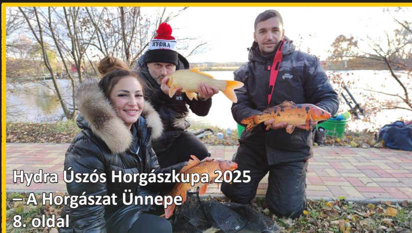
Hydra Úszós Horgászkupa 2025 – A Horgászat Ünnepe 8. oldal

A cikkeket, fotókat szerzői jog védi, azok másolása, másodközlése csak a Kiadó írásbeli engedélyével le- hetséges! HorgászKalandok © mind- en jog fenntartva!