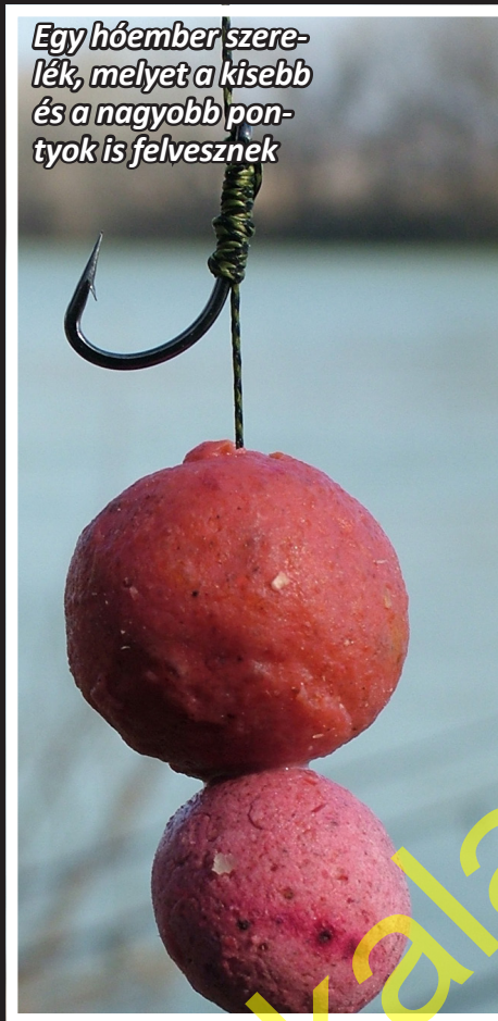
Egy hóember szerelék, melyet a kisebb és a nagyobb pontyok is felvesznek