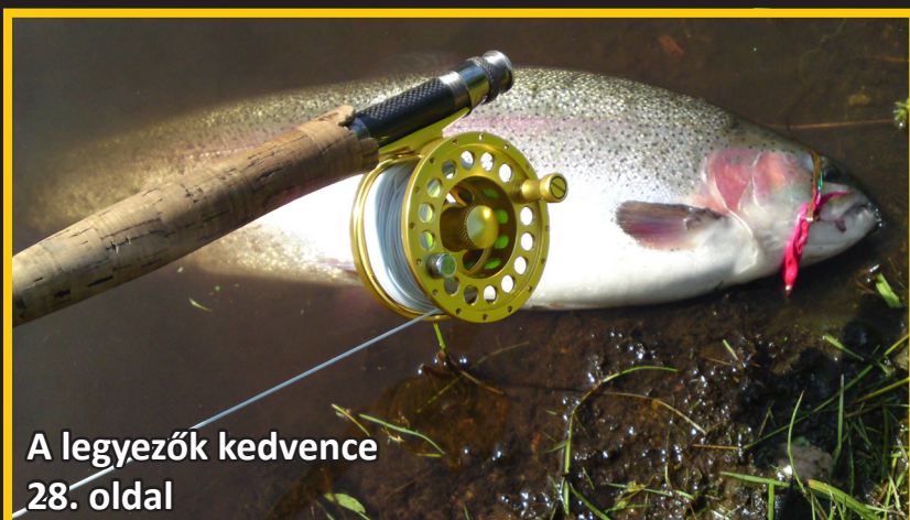
A legyezők kedvence 28. oldal