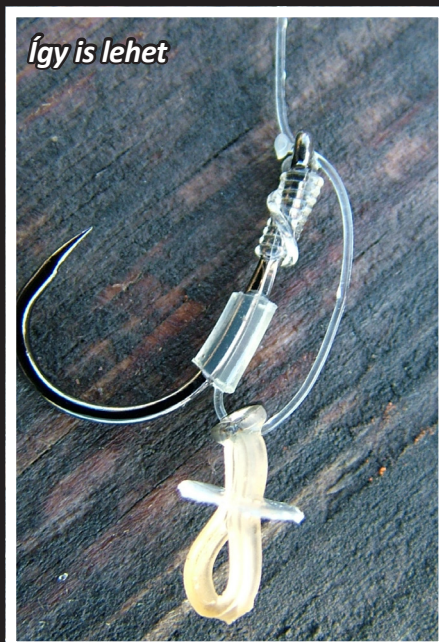
Így is lehet