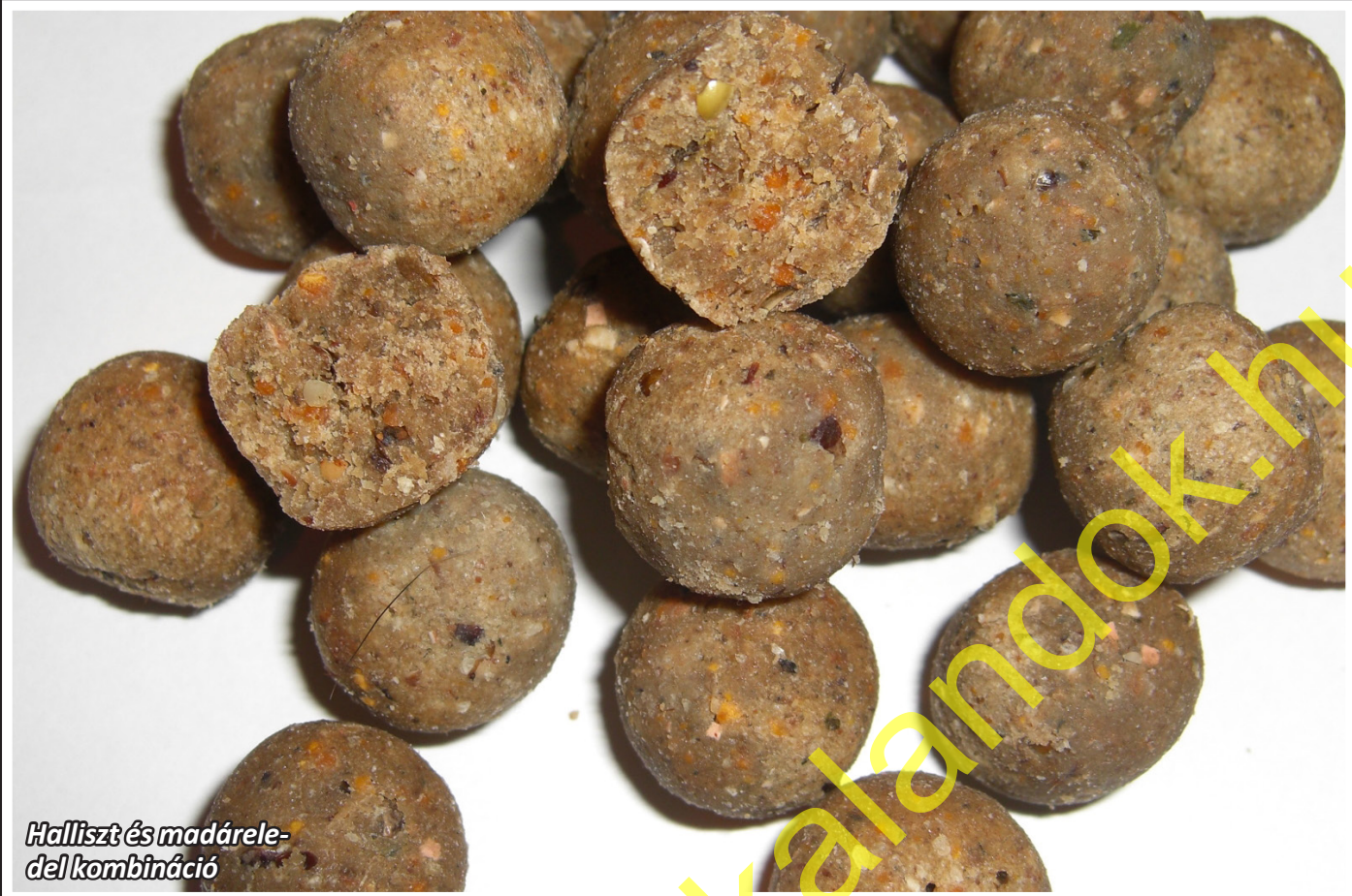
Halliszt és madárel- del kombináció

természetesen bojli készítésére is. A fehér húsú halak húsból és bőrből készül. Magas olaj és fehérjertartalma miatt a legtöbb hallisztan alapuló alapkeverék-nél első osztályú terméknek számít, melyet fő mennyiségi összetevőként lehet használni. Hátránya, hogy mivel nagyon nagy az olajtartalma, nehezen formálható.