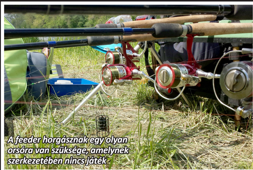
A feeder horgásznak egy olyan orsóra van szüksége, amelynek szerkezetében nincs játék

A feeder horgásznak egy olyan orsóra van szüksége, amelynek szerkezetében nincs játék, fogaskerekei