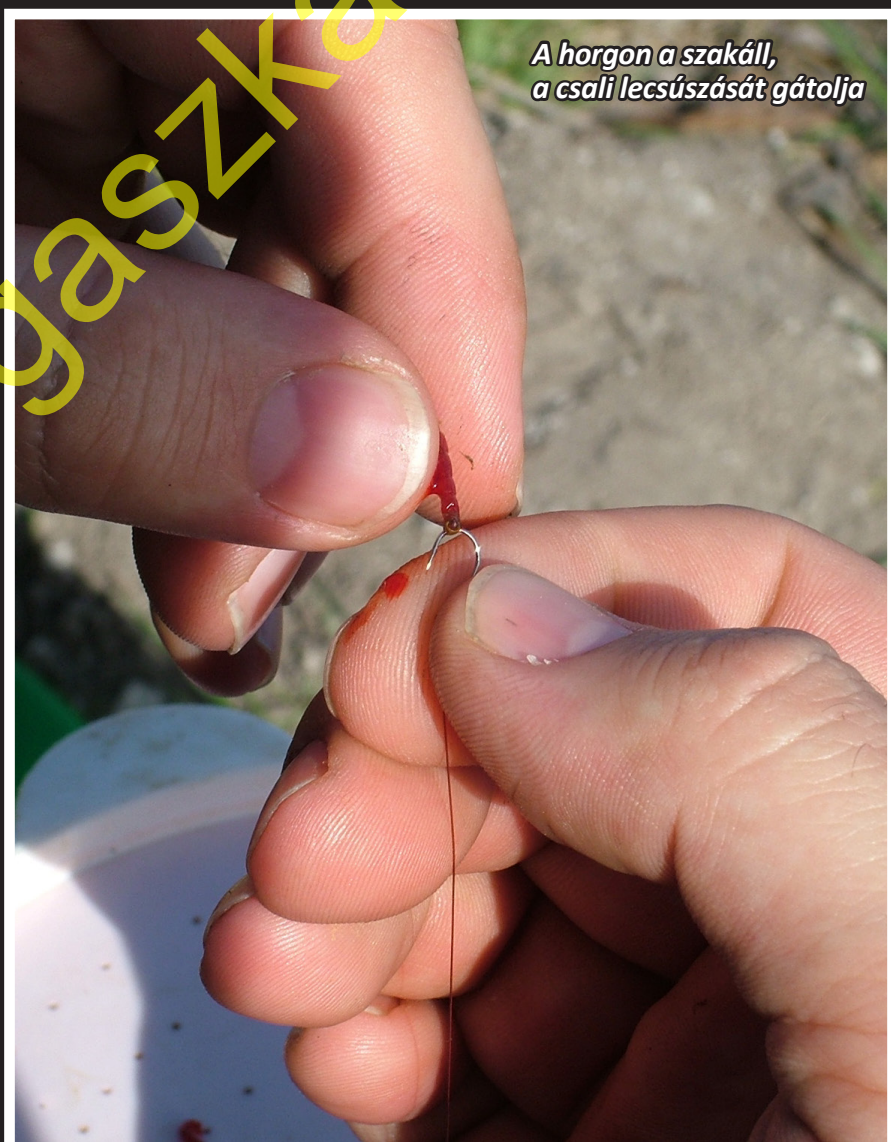
A horgon a szakáll, a csali lecsúszását gátolja