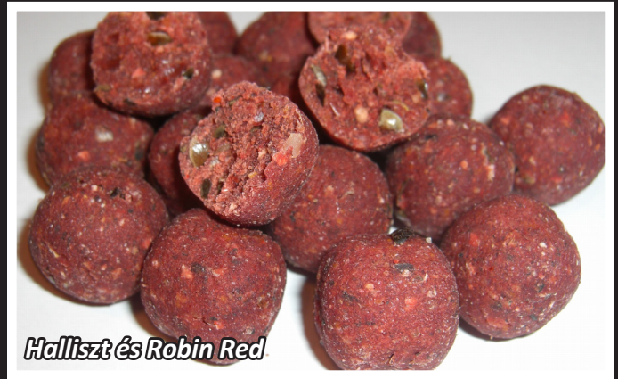
Halliszt és Robin Red

Másik előnyük ezeknek a bojliknak, hogy „természetesnek” mondhatók. A hallisztek nagyon sok tulajdonsága azonos a ponty természetes táplálékával. Ezért a ponty megvizsgálja, hogy a bojli táplálékforrás-e, és amikor rájön hogy ízetes, könnyen emészthető és tápláló, valószínűleg beveszi napi menüjébe. Ez magyarázza a halliszt alapú bojlik folyamatos sikerét. A pontyok azonnal elfogadják és nagy mennyiséget falnak fel belőlük, feltéve ha a horgász nem viszi túlzásba a bojlikban az adalékokat és az aromákat.